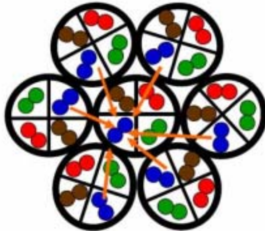
图 1. 图示一根线缆的一组线对受到的其他线缆的串扰影响

相邻线缆中绞结率相同的线对间的耦合是最大。相邻线缆中绞结率不同的线对间的耦合要小得多。当然这一规律并不总是对的。